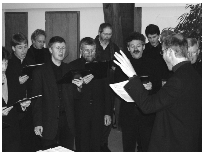
Impression aus einer Probe der Kantorei.

Craig Shepards Konzeptkomposition They can tell you erklingt dazwischen. Die stille Musik des jungen Komponisten soll Zeit und Raum öffnen und den Zuhörenden so die Möglichkeit geben in sich zu hören, die Stimmen der Verstorbenen zu vernehmen und eine Zeitlang mit ihnen zu gehen.